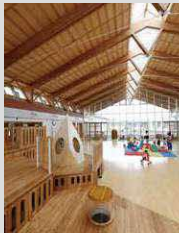
▷ 交流施設(교류 시설) 使用樹種/トドマツ、カラマツ 사용 수종/전나무, 낙엽송