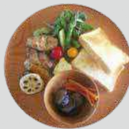
▷ 食器(식기) 使用樹種/ナラ、タモ、ニレなど 사용 수종/참나무, 들메나무, 느릅나무속 등