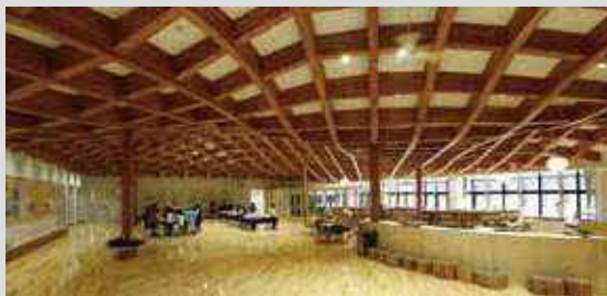
▷ 小学校(초등학교) 使用樹種/トドマツ、カラマツ、カバ、シナ 사용 수종/전나무, 낙엽송, 자작나무속, 피나무