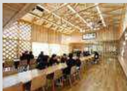
▷ 中学校(중학교) 使用樹種/スギ 사용 수종/삼나무