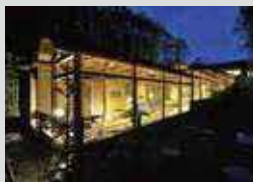
▷ 旅館(여관) 使用樹種/トドマツ、カラマツ、ナラ、アカエゾマツなど 사용 수종/전나무, 낙엽송, 참나무, 붉은가문비나무