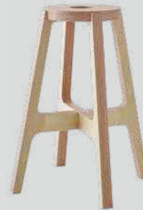
▷ 家具(가구) 使用樹種/シナ、シラ카バ 사용 수종/피나무, 자작나무 등