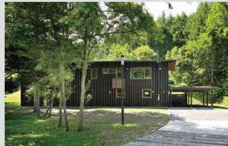
▷ ゲストハウス(게스트하우스) 使用樹種/カラマツ、タモなど 사용 수종/낙엽송, 들메나무 등