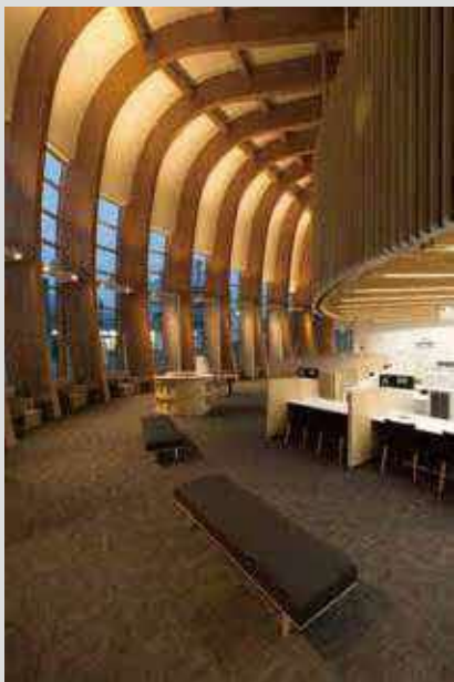
▷ 銀行(은행) 使用樹種/トドマツ、カラマツなど 사용 수종/전나무, 낙엽송 등

대형 건축물을 지탱하는 내구성, 무심결에 만지고 싶어지는 질감. 'HOKKAIDO WOOD'는 각 수종의 특성을 활용하여 나무와 함께 사는 기쁨을 널리 전파하고 있습니다.