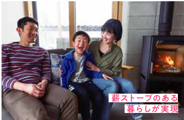
薪ストーブのある暮らしが実現