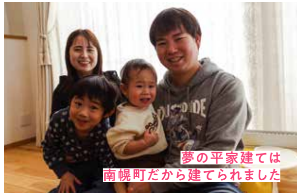
夢の平家建ては南幌町だから建てられました